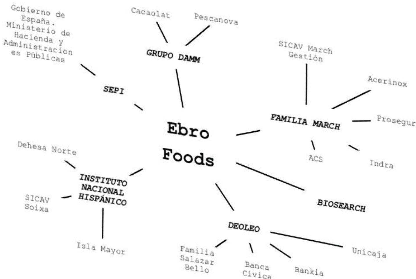
Entramado accionario de Ebro Foods.

do español y evite activamente esta vulneración del derecho humano a la alimentación provocado por una empresa con sede social en su jurisdicción.