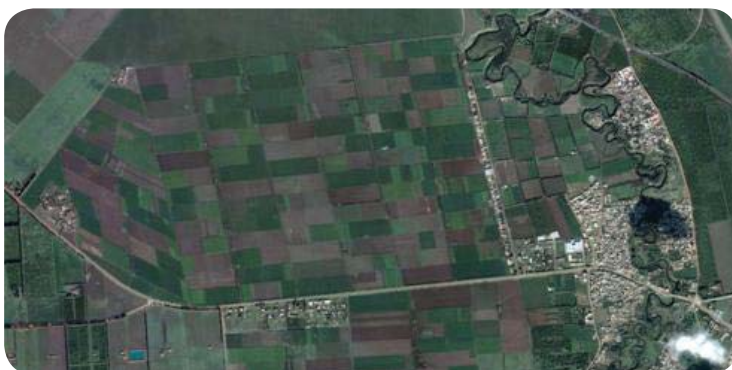
La empresa Mundiriz ocupa más de 2500 Ha en Larache.

Mundiriz llegó a Marruecos a finales de los años 90 y hoy ocupa más de 2500 Ha en Larache, produce el 60% del arroz consumido en Marruecos, bajo el mismo nombre con el que opera en el estado español: La Cigala. Marruecos además ha exportado al estado español una media de 1.700 toneladas en los últimos tres años. Cabe señalar que la tierra agrícola en Marruecos no puede ser comprada por personas extranjeras, solamente alquilada y que el precio del alquiler que paga la empresa de capital español es considerablemente más bajo que el de mercado (unas 10 veces menor).